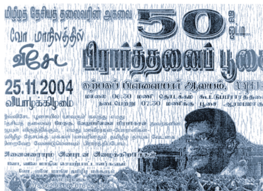
Geburtstagsfeier in Lausanne. Mittels Flugblatt wurde in der ganzen Schweiz zu einer Feier zum Geburtstag Velupillai Prabhakarans am 25.11.2004 nach Lausanne eingeladen.

Die TRO bezeichnet sich selbst als von der LTTE unabhängige Nichtregierungsorganisation, obwohl in der Vergangenheit Verbindungen zwischen der LTTE und der TRO bestanden. Die TRO ist laut Presseberichten bereit, ihre Bücher offen zu legen.