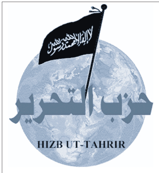
Emblem der Hizb-ut-Tahrir. Die Gruppierung hat auch in der Schweiz Sympathisanten.