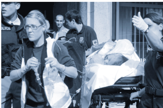
Messerangriff auf Imam. Der Imam des Centre Islamique de Lausanne wurde am 8. Oktober 2004 von einem offenbar unter Verfolgungswahn Leidenden verletzt.