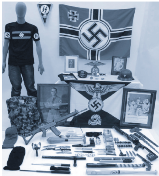
Rechtsextremes Material. Das Material wurde bei Hausdurchsuchungen im Kanton Luzern beschlagnahmt.

Die PNOS unterhält auch Kontakte zu teilweise gewalttätigen in- und ausländischen rechtsextremen Gruppierungen. Einzelne Exponenten der PNOS kamen wiederholt mit dem Gesetz in Konflikt.