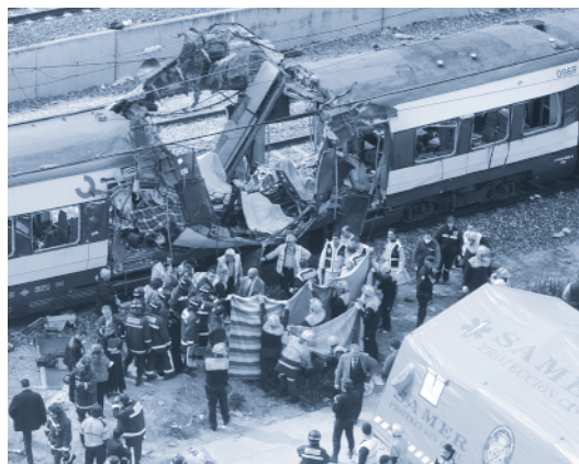
Zerstörter Vorortszug. Am 11. März 2004 wurden vier Vorortszüge in Madrid Ziel von Anschlägen.